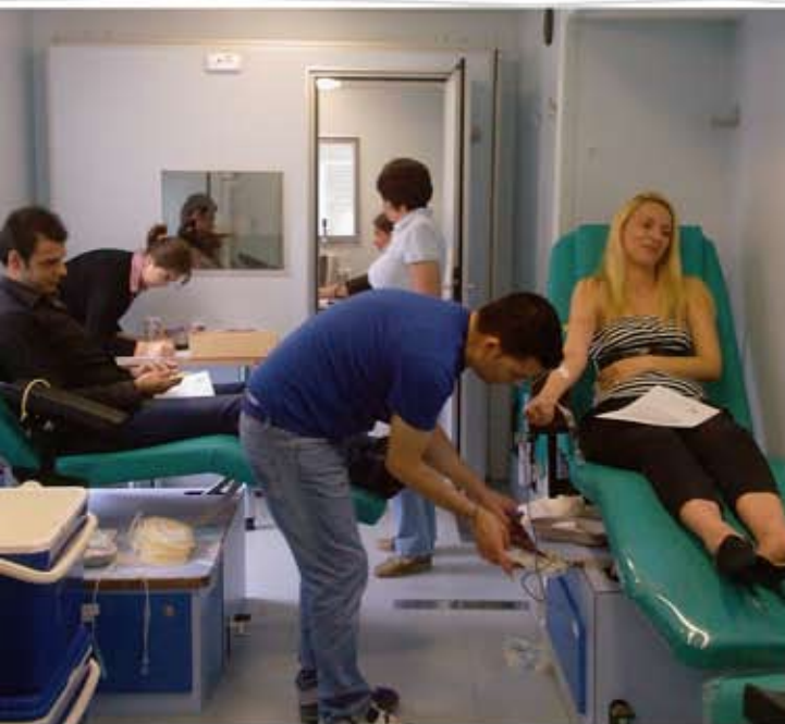
Αιμοδοσία προσωπικού στην έδρα της INTERLIFE.