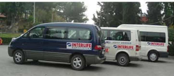
Προσφορά στον Πανελλήνιο Σύλλογο Παραπληγικών Βορείου Ελλάδος