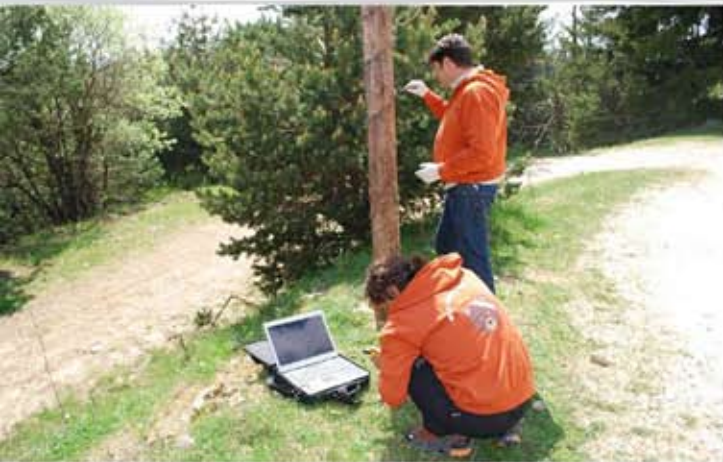
Υποστήριξη των δράσεων της Καλλιιστώ