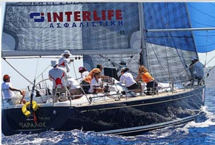
Χορηγία Ιστιοφόρου Πάραλος & Διεθών Ιστιοπλοϊκών Αγώνων του Ν.Ο.Θ.