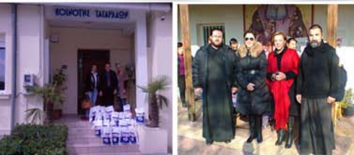
Ενίσχυση Κοινωνικού Παντοπωλείου Ι.Μ. Σταυρουπόλεως & Νεαπόλεως και κοινότητας Ταγαράδων Θεσσαλονίκης