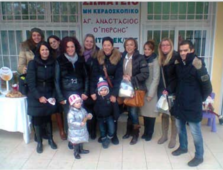
Το προσωπικό της INTERLIFE στο Χριστουγεννιάτικο Παζάρι του Σωματείου για Α.Μ.Ε.Α. "ΑΓΙΟΣ ΑΝΑΣΤΑΣΙΟΣ Ο ΠΕΡΣΗΣ"