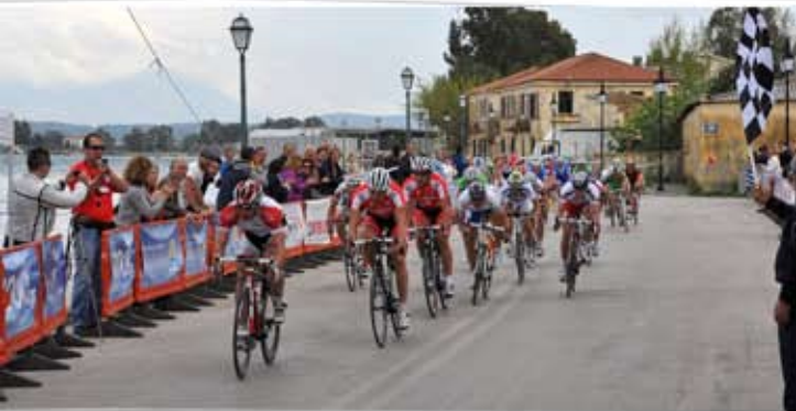
Υποστήριξη 17ου Διεθνούς Ποδηλατικού Γύρου.