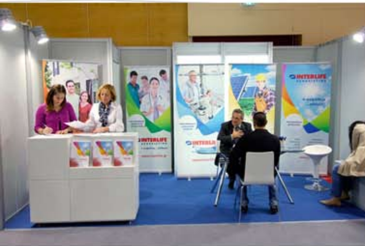
Συμμετοχή της INTERLIFE στο FORUM Εργασίας του ΟΑΕΔ

Η εταιρεία ενημέρωσε όλους τους συμμετέχοντες για τις προσφερόμενες θέσεις απασχόλησης, προέβη σε προσωπικές συνεντεύξεις και αξιολογήσεις βιογραφικών σημειωμάτων που κατατέθηκαν και προχώρησε στη δημιουργία νέων θέσεων εργασίας. Τέλος, η INTERLIFE Ασφαλιστική δεσμεύθηκε για τη στήριξη στο μέλλον των δράσεων του ΟΑΕΔ αλλά και του ανθρώπινου δυναμικού που διεκδικεί ίσες ευκαιρίες στην απασχόληση.