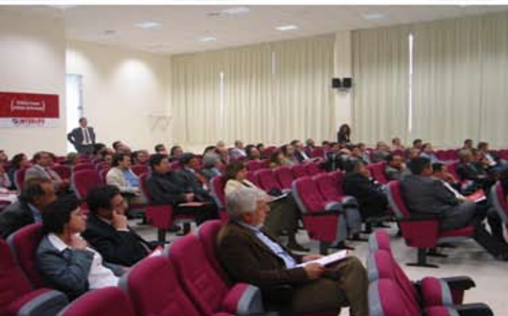
Παρακολούθηση Σεμιναρίου στην έδρα της INTERLIFE